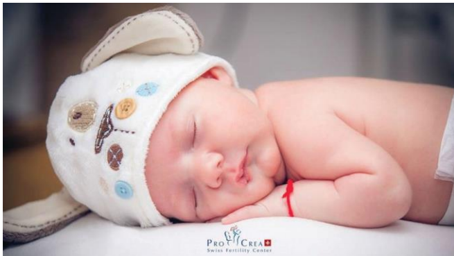
258 enfants nés jusqu'au 31.12.2018