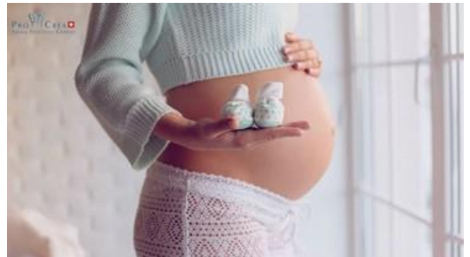
150 grossesses en cours